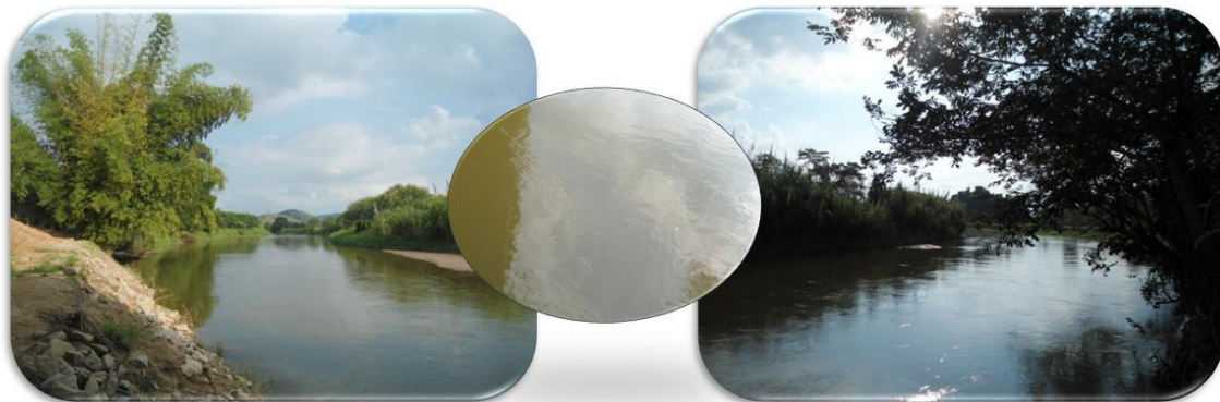
SJ #3 - Ponte Capivari – UTM 23 K 767188 7493710