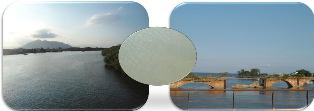
SJ #2 - Ponte Br 101 – UTM 23 K 771088 7502275